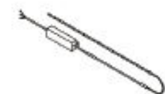
Kit standard (18 LED): BLD-7001