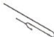
Pro-Kit (extension 30 LED): BLD-7002