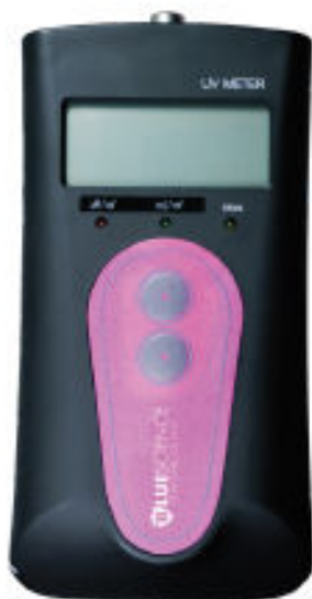
Radiomètre UV-c : BLD-9700